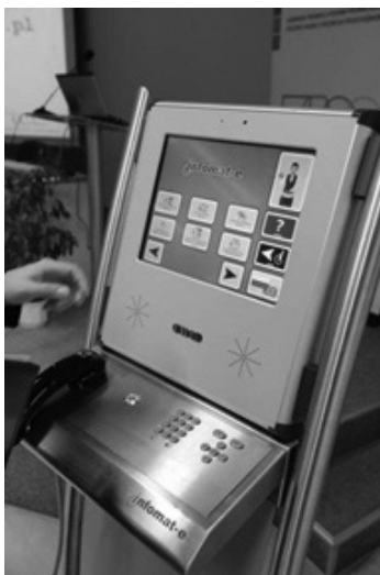
Fotografia 1. Kiosk informacyjny informat-e

da moduł języka migowego (!), intuicyjne piktogramy, pomoc kontekstową, rozpoznawanie mowy czy syntezę mowy. Obsługę urządzenia rozpatrzono w trzech kategoriach: zadawanie pytań, uzyskiwanie odpowiedzi oraz pomoc, która umożliwia zapoznanie się z różnymi kategoriami informacji [5].