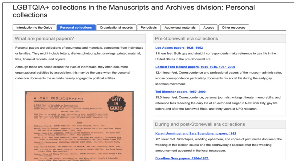
Rysunek 2. Jedna z kolekcji udostępnianych przez NYPL

kolekcji archiwalnych, które obejmują listy, rękopisy, zdjęcia, plakaty oraz materiały audiowizualne. Ich liczba sięga setek tysięcy obiektów ( LGBTQ Initiative , 2024). Poświęcono im odrębną stronę internetową dostępną pod adresem: https://www.nypl.org/spotlight/pride/research . Widok jednej z takich kolekcji przedstawiono na Rysunku 2.