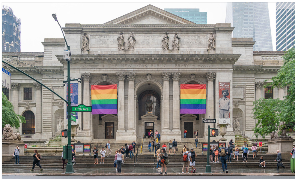
Rysunek 3. Zdjęcia dokumentujące wsparcie okazane społeczności LGBTQ+ przez pracowników New York Public Library