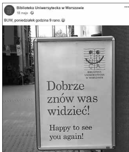
Il. 1. Jeden z najpopularniejszych postów w czasie wiosennego lockdownu, odnoszący się do otwarcia Biblioteki Uniwersyteckiej w Warszawie.

w dniu 25 czerwca 2020 r., najpopularniejszym postem wśród użytkowników (z punktu widzenia liczby polubień) był post Biblioteki Jagiellońskiej o jej ponownym częściowym otwarciu (opublikowany 20 maja). Post zgromadził 229 polubień, 15 komentarzy, 26 udostępnień, w sumie 358 wszystkich reakcji użytkowników. Drugim w kolejności był post udostępniony przez Bibliotekę Uniwersytecką w Warszawie z dnia 18 maja. Dotyczył on otwarcia instytucji dla użytkowników. Zgromadził 215 polubień, 3 komentarze, 13 ponownych udostępnień, w sumie 314 reakcji. Trzeci w kolejności okazał się post udostępniony także przez Bibliotekę w Warszawie na temat pobicia rekordu liczby wypożyczeń książek. Post został opublikowany w dniu 11 marca. Zgromadził 195 polubień, 21 komentarzy, 10 ponownych udostępnień, w sumie 359 reakcji (Gmiterek, 2021). Największą popularnością cieszyły się więc treści odnoszące się do funkcjonowania budynków instytucji oraz oferowanych przez nie usług.