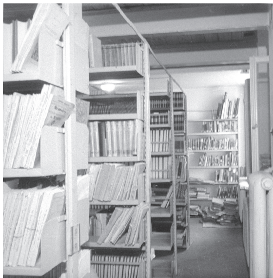
Il. 4. Wnętrze Biblioteki Państwowego Muzeum Zoologicznego w roku 1948

sygn. 3/27/0/-/476/12.