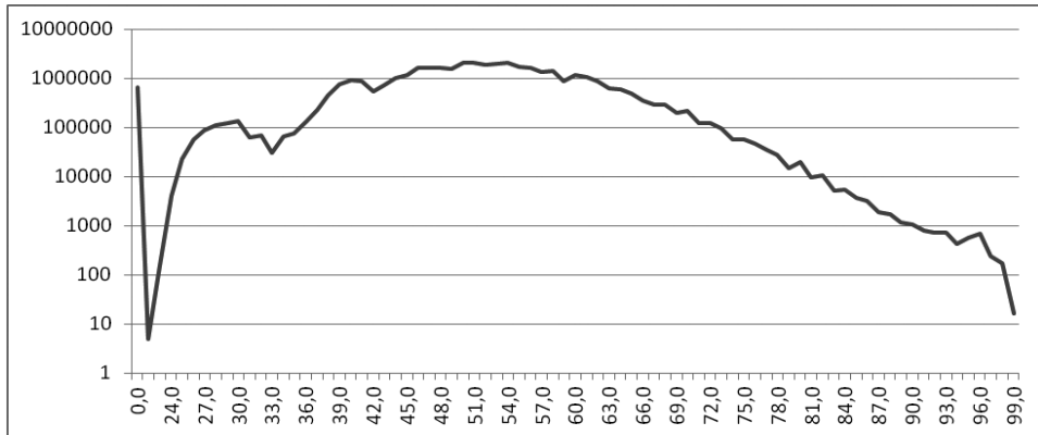
Rys. 1. Histogram miary Jaro-Winkler dla analizowanych rekordów danych

danych, zwłaszcza w kontekście manualnej ich weryfikacji. Jednak patrząc na rysunek 1 widzimy, że dla wartości podobieństw większych od 90% liczba rekordów oscyluje wokół rzędu wielkości 1 tys. W analizowanej bazie całkowita liczba rekordów z miarą podobieństwa, większą lub równą 90%, wyniosła 5406, co stanowi 0,13% liczby wszystkich możliwych par i 60% liczby wszystkich rekordów opisujących autorów. Nawet