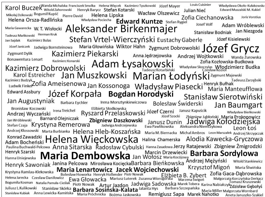
Ryc. 2. Autorzy „Przełęcz Biblioteczna” w l. 1971-2012