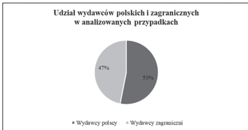
Wykres 2. Procentowy udział polskich i zagranicznych wydawców reprezentujących analizowane czasopisma. Dane według liczby analizowanych unikatowych czasopism. Oprac. na podstawie danych dostarczonych przez Bibliotekę Uniwersytetu Łódzkiego.

Istotne dla wyników tego badania jest cytowane już Zarządzenie nr 145 Rektora Uniwersytetu Łódzkiego... z sierpnia 2023 r., które zobligowało koordynatorów dyscyplin do nawiązania kontaktu – pośrednio lub bezpośrednio – z Biblioteką UŁ. W związku z premiami za publikacje w ramach programu IDUB zlecono 32 analizy czasopism. Co ważne, przeważają analizy dotyczące czasopism polskich wydawców, w tym takich pozostających niemal poza podejrzeniem o nieetyczność, niekomercyjnych, jak m.in. wydawnictw instytutów Polskiej Akademii Nauk, Wydawnictwo