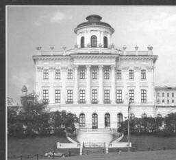
ОБРАЗ ХРАМА КНИГИ

W tej części Europy funkcjonuje nierzadko praktyka (skąd przywleczona?, no?) generowania dyrekcji dużych bibliotek spośród osób spoza zawodu. Nominaci zaś nie mają potem żadnych oporów przed wypowiedzaniem się na